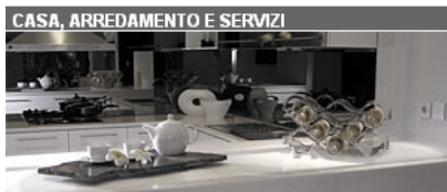
CASA, ARREDAMENTO E SERVIZI

Fai di Repubblica Firenze la tua homepage | Redazione | Scriveteci | Rss/xml | Servizio Clienti | Pubblicità